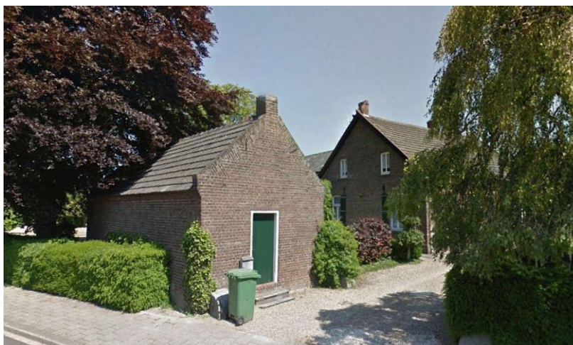
Een van de voorgedragen nieuwe gemeentelijke monumenten is het boerderijcomplex op de hoek Strateris en Hoebensstraat, inclusief het industriële erfgoed in de vorm van het oude 'melkfabriekje' (vooraan op de foto).