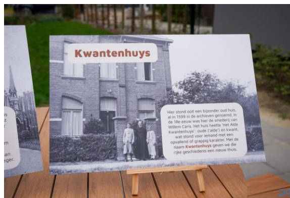
Fig. 7, 8, 9, 10 en 11. Foto's van de officiële presentatie.