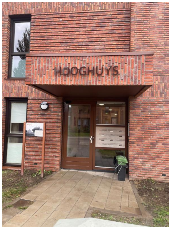
Fig. 12 en 13. De naamgeving op de definitieve locatie.