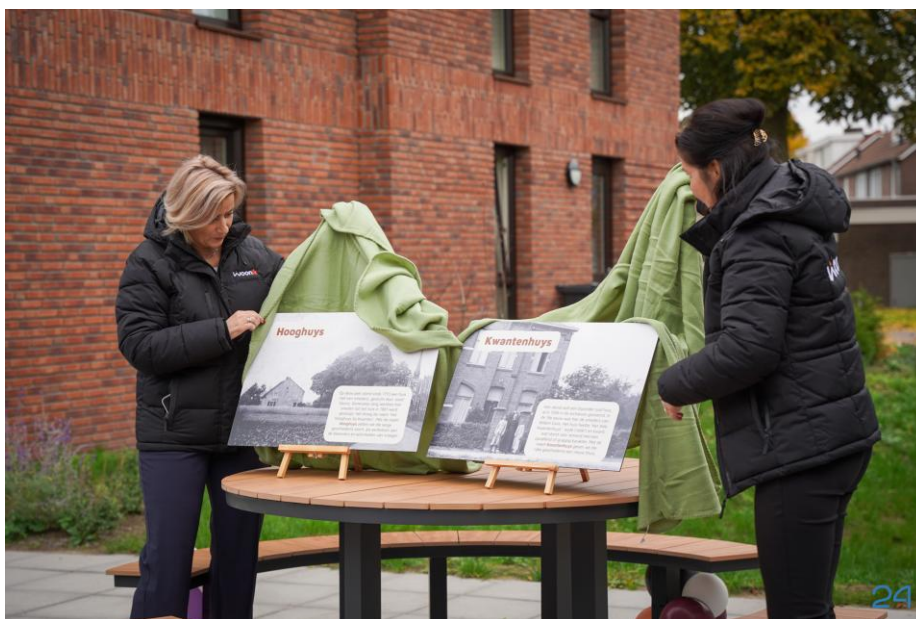
Fig. 6. Onthulling van de naamborden.

Maandagmiddag 13 oktober werd de opening van het woonproject Carisplan gevierd met een feestelijke borrel voor bewoners. Inmiddels heeft iedereen namelijk zijn of haar intrek genomen in de nieuwe appartementen.