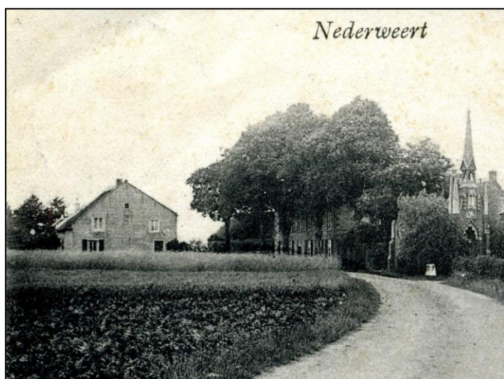
Fig. 5. Links de westgevel van huis 2 en uiterst rechts de kapel aan de Moesemanstraat. Ansichtkaart, ca. 1910, collectie Stichting Geschiedschrijving Nederweert.

Op de splitsing met de Moesemanstraat stond tot 1965 de Mariakapel gewijd aan de Bedroefde Lieve Vrouw. De omringende bomen (drie essen) staan er nog in het plantsoentje.