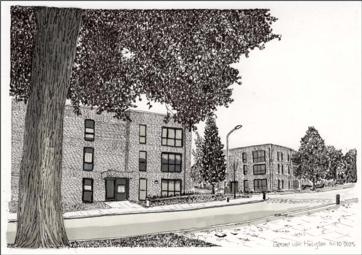
Fig. 2. Tekening van de beide appartementengebouwen, van de hand van Gerard van Heugten (oktober 2025).