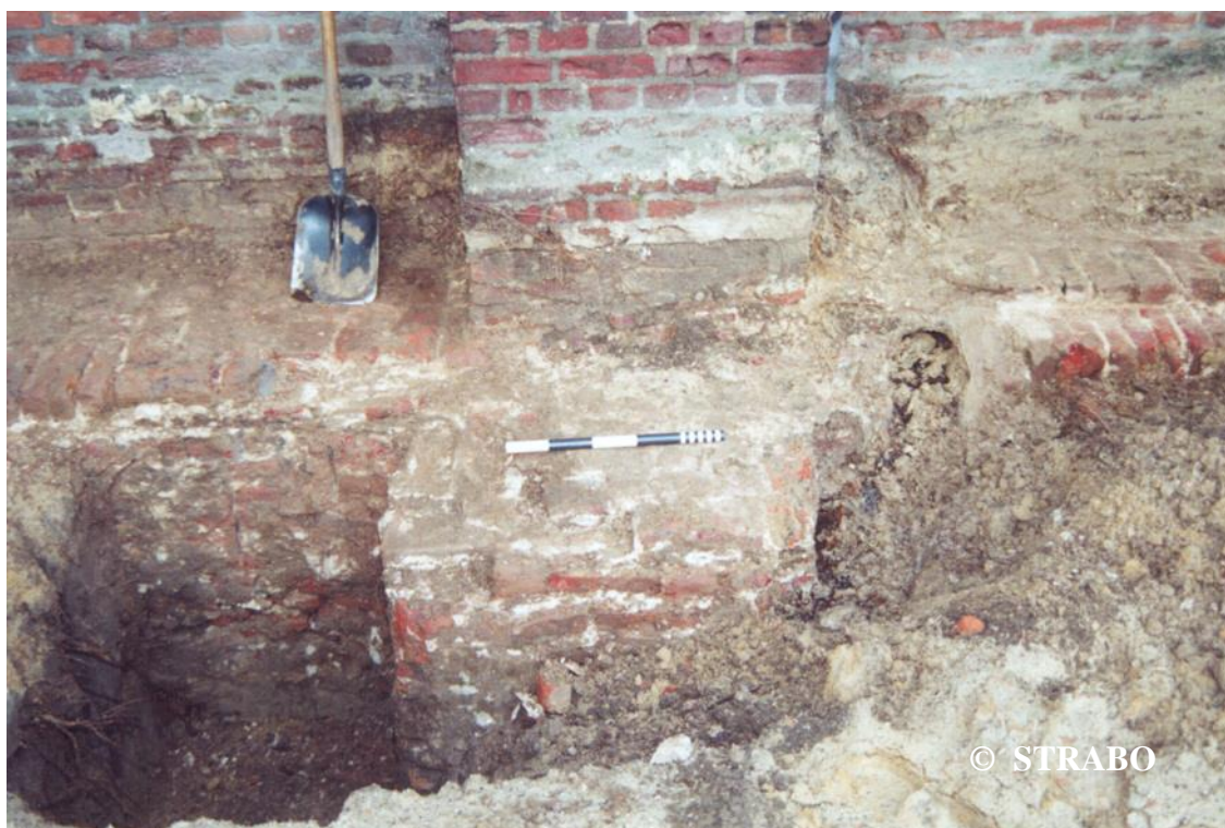
Figuur 3. Fundering bij steunbeer, gezien naar het noorden.