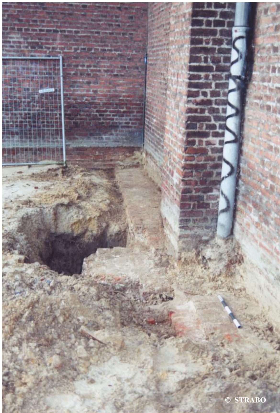
Figuur 4. Overzicht van de funderingsmuur, gezien naar het westen.