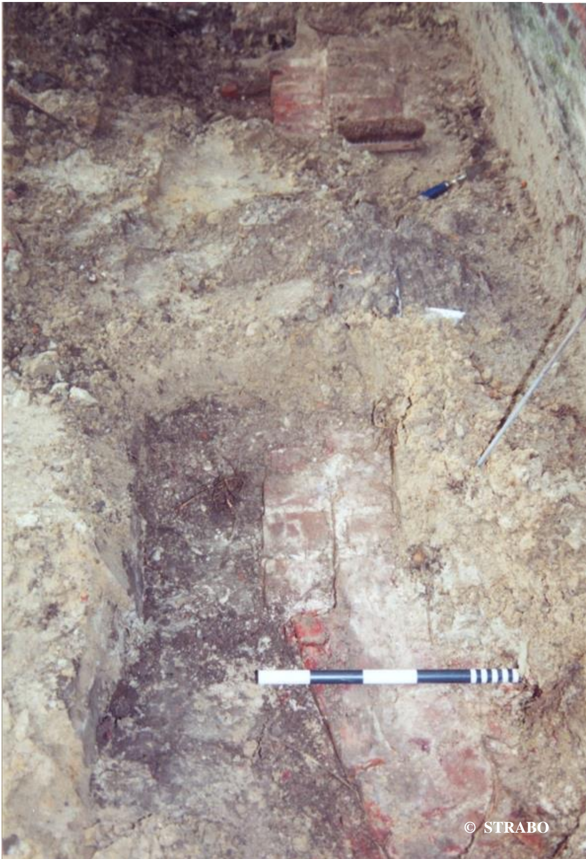
Figuur 6. Knik in de contour van de fundering, gezien naar het westen.