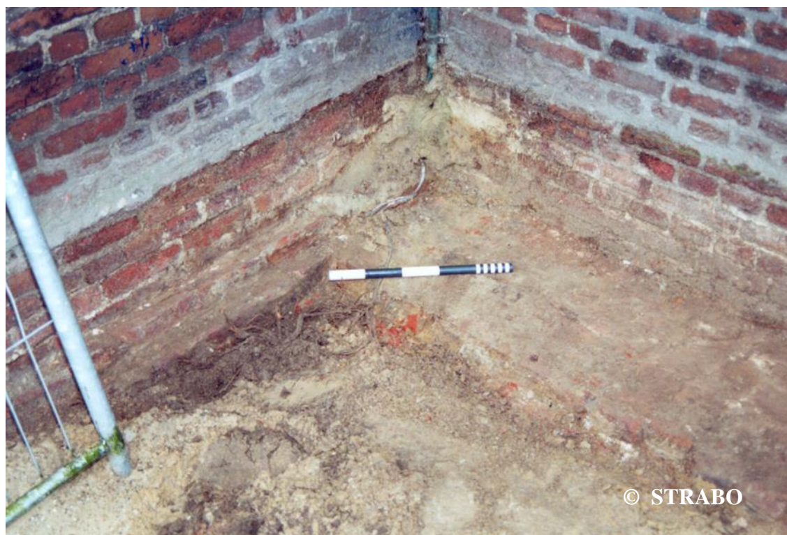
Figuur 7. Binnenhoek van priesterkoor en zuidbeuk.