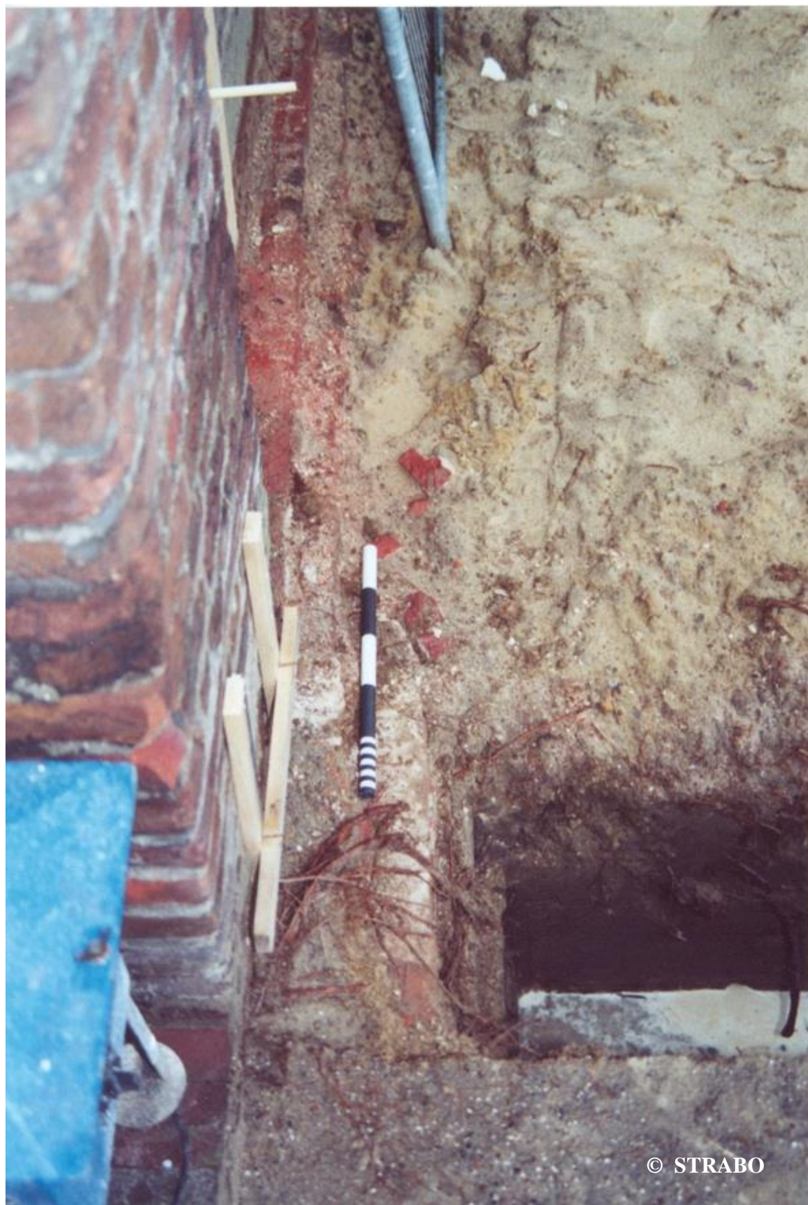
Figuur 5. Fundering bij de hoek van de zuidbeuk.