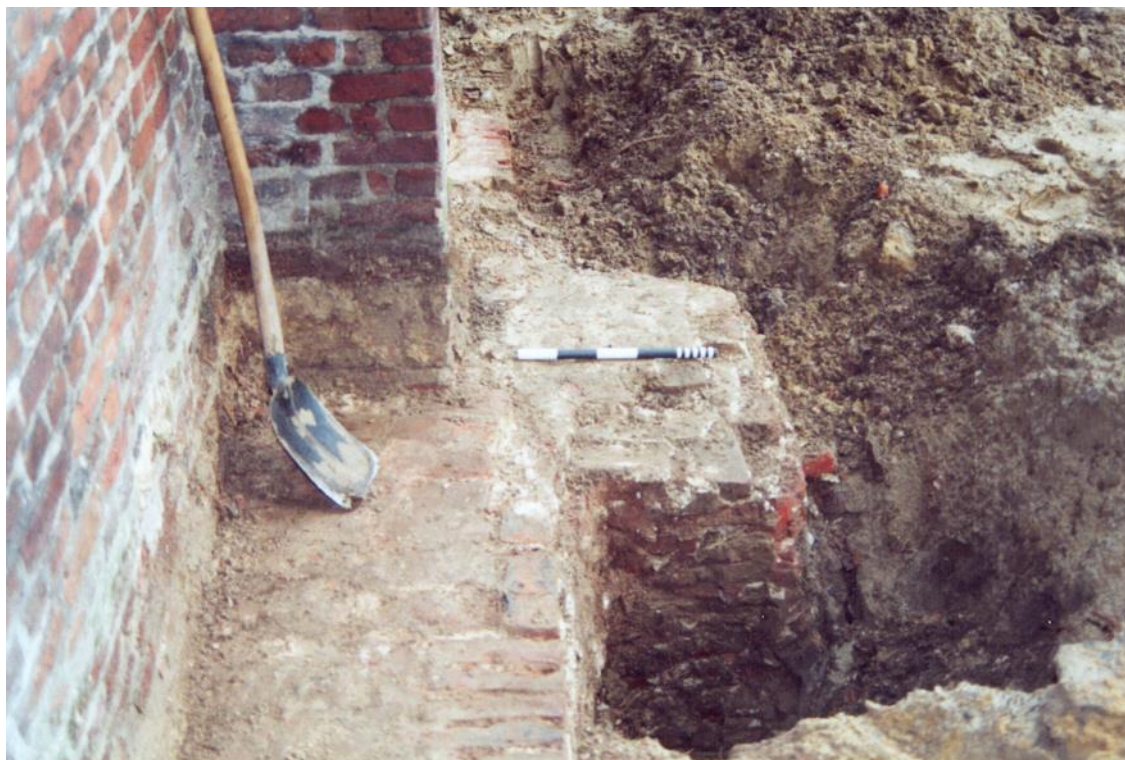
Figuur 2. Fundering bij steunbeer, gezien naar het oosten.