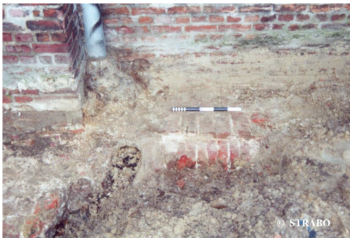
Figuur 8. Subrecente waterafvoer door fundering geleid.