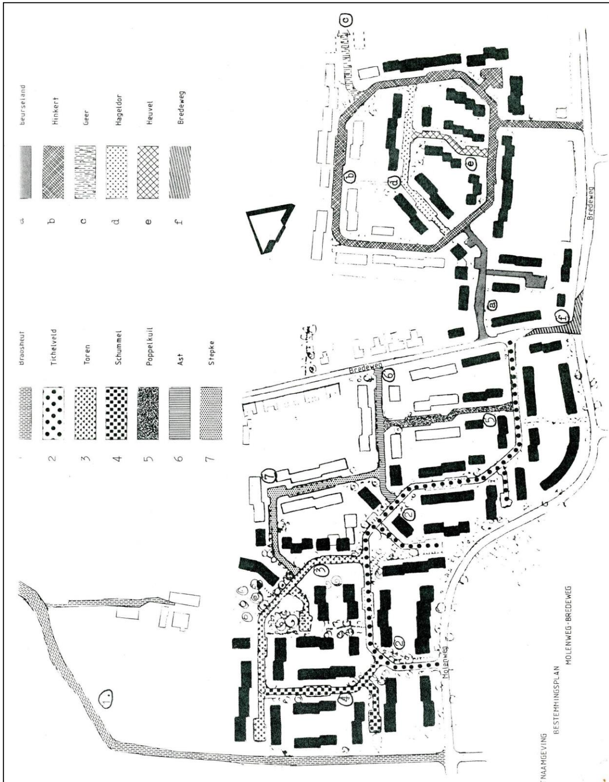
Fig. 1. Ligging van de voorgestelde straatnamen. Kaartje overgenomen uit raadsvoorstel 85-126.

De uitvoering van een groot deel van de straatnamen geschiedde in de jaren 1985-1987. De namen Geer en Hinkert werden pas in 1990 geïmplementeerd.