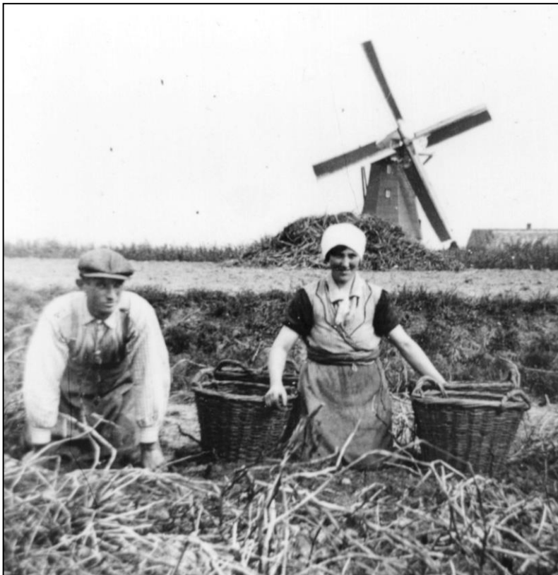
Fig. 1. De achtkantmolen aan de Bredeweg in Nederweert, aan de rand van het uitbreidingsplan Kerneelhoven.

De ingebruikname werd gepubliceerd op 15 augustus 2002.