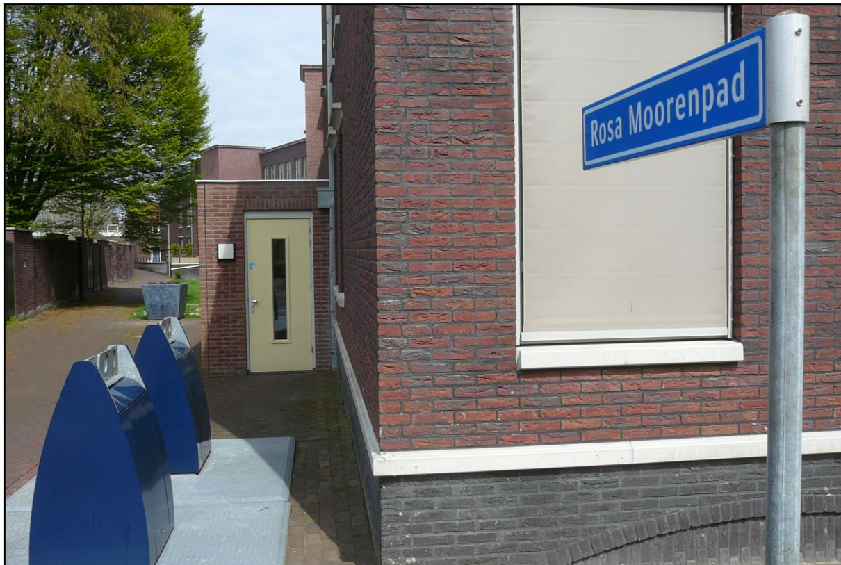
Fig. 2. Realisatie van de straatnaam Rosa Moorenpad aan de noordzijde van zorgcomplex Domus Bona Ventura.

Het in de Gemeentelijke Straatnamencommissie Nederweert voorgestelde idee om de naam Rosa Moorenpad toe te kennen werd onverkort uitgevoerd in het begin van 2013.