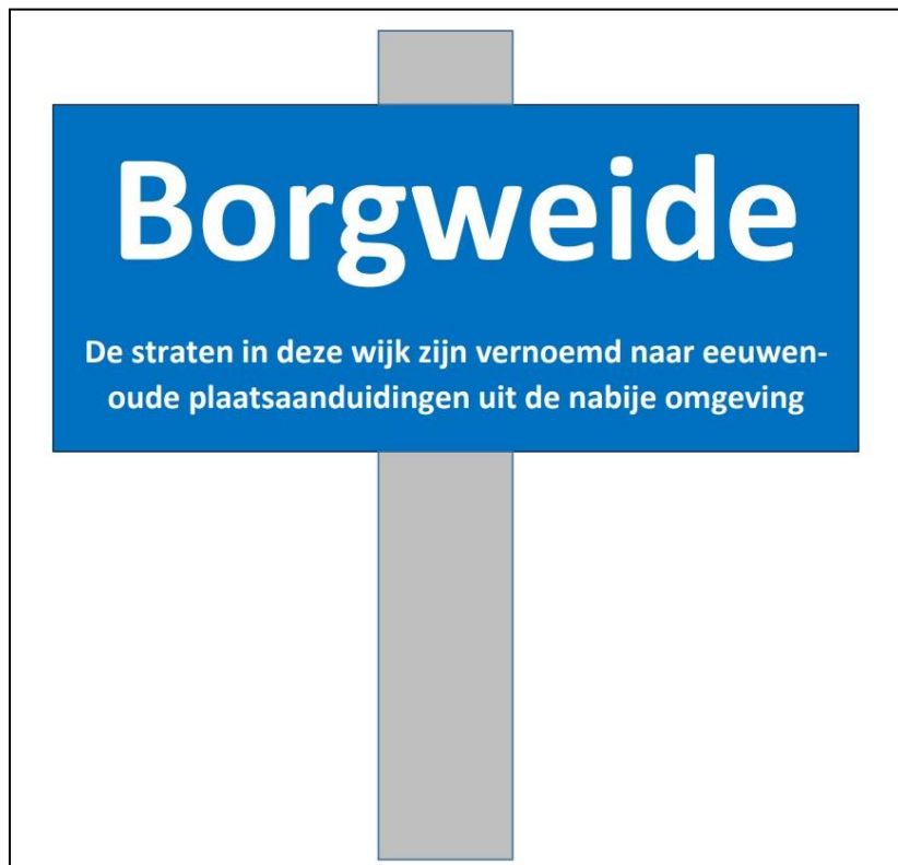
Fig. 2. Realisatievoorstel. Tekening: A. Bruekers.

Bij de behandeling van het voorstel werd voorgesteld om het straatnaambord te voorzien van een korte historische toelichting die ook kon dienen als informatiepaneel voor alle andere straatnamen in hetzelfde gebied. Daartoe werd het volgende ontwerp ingediend. De realisatie werd helaas nooit ter hand genomen.