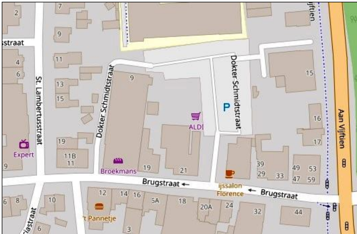
Fig. 2. Localisatie van de straatnaam Dokter Schmidtstraat.