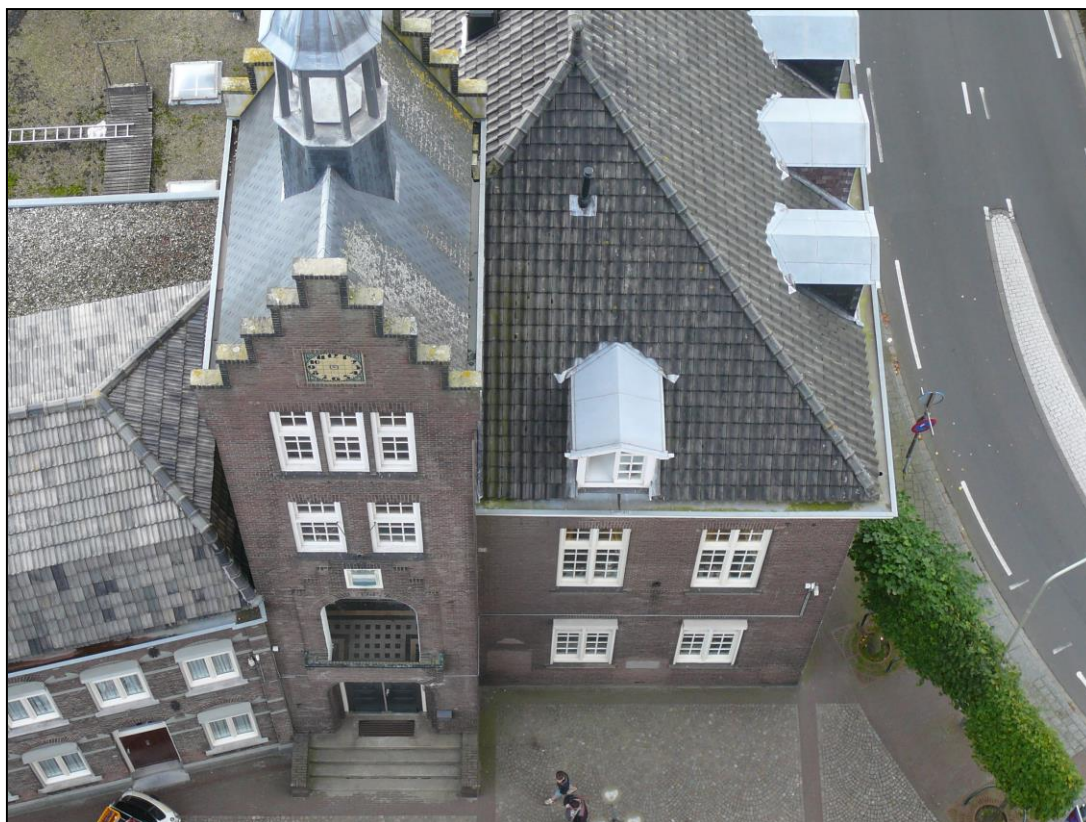
Fig. 1. Het in 1920 gebouwde raadhuis in de Kerkstraat, oudtijds ‘Speelhuys’ genaamd. Foto A. Bruekers, 2010.

PS gezien de betrokkenheid van de RABO-bank bij de totstandkoming van het plein, en vanwege het feit dat de bank (net als het gemeentehuis) aan het nieuwe plein gelegen is, ware het ook te overwegen een der grondleggers van de jubilerende Nederweeter “Boerenleenbank” met een naam te herdenken.