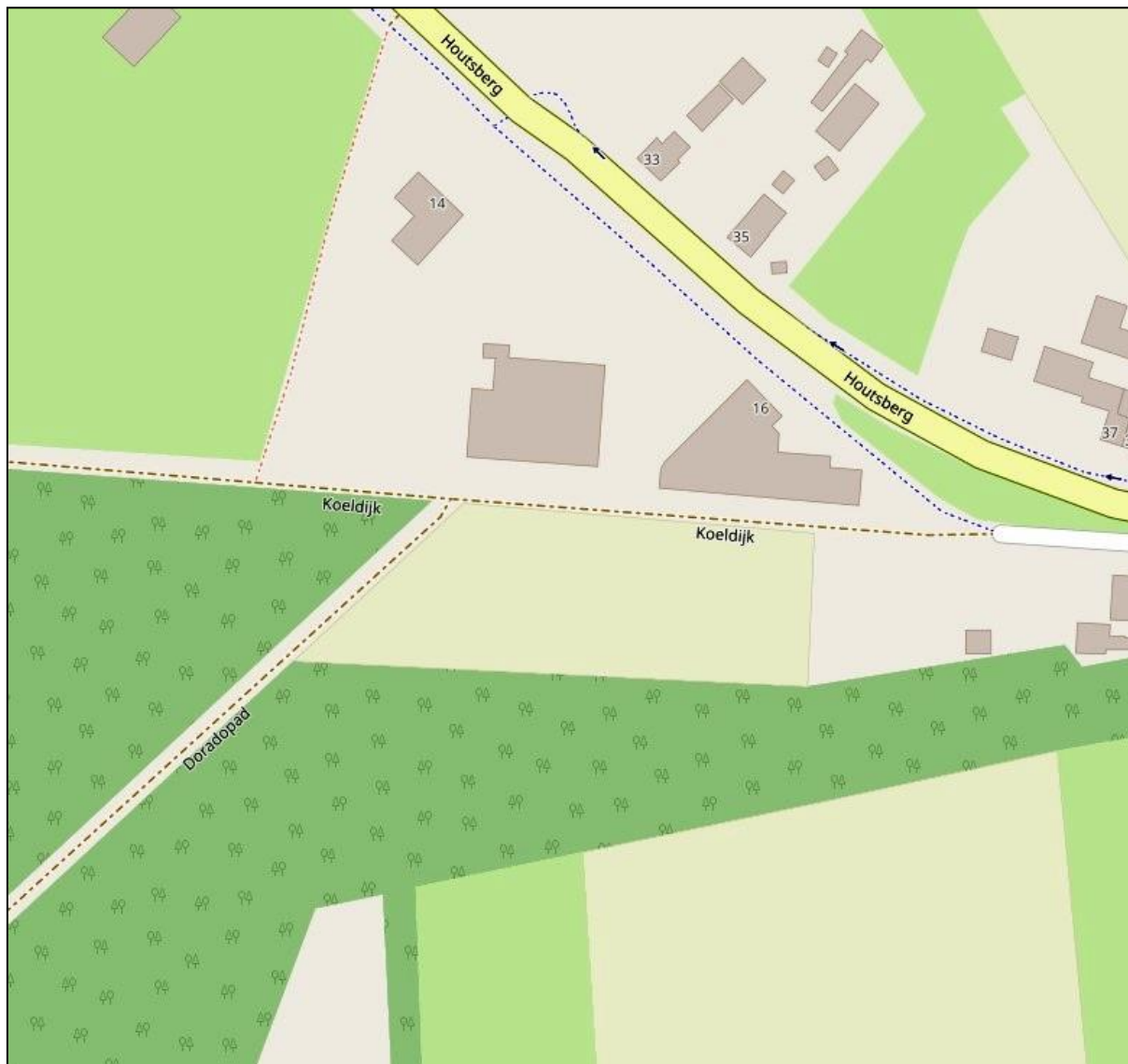
Fig. 2. Ligging van de Koeldijk en het Doradopad.

Na rijp beraad in de Straatnamencommissie werd geopteerd voor Doradopad (conform voorstel) respectievelijk Koeldijk (i.p.v. de modernere variant Kuldijk).