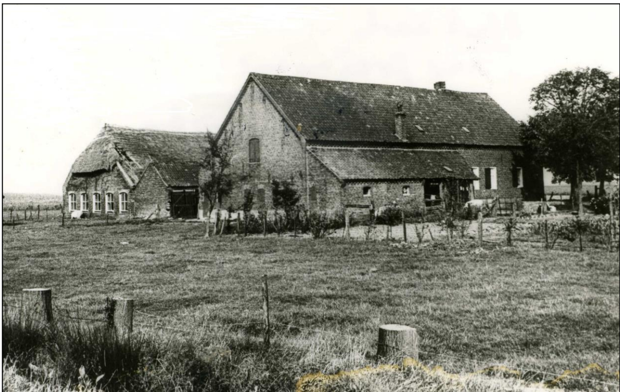
Fig. 3. De hoeve Uijtwijck of Plucksack in 1960.