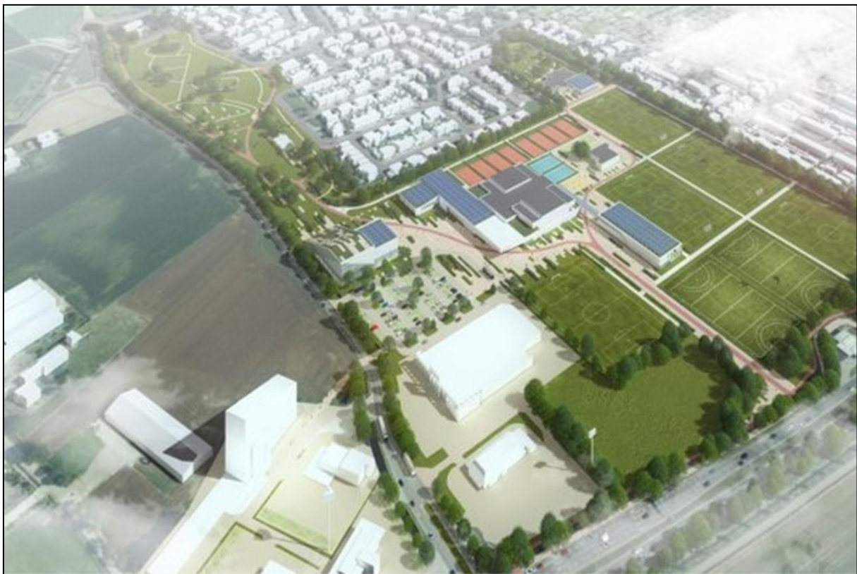
Fig. 1. Impressie van het project.

Ten behoeve van de beantwoording van de vraagstelling van dhr. Mansvelt is een verkenning uitgevoerd van oude toponiemen in de nabije omgeving van het projectterrein. De resultaten van die verkenning worden in het volgende hoofdstuk in samengevatte vorm beschreven. Gevolgd door een voorstel tot naamkeuze.