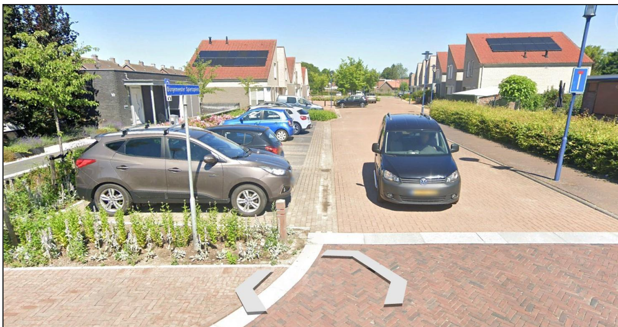
Fig. 3. Het Burg. Spiertzplein in 2023.

Uiteindelijk werd gevolg gegeven aan het besluit van het College van B&W en ging het binnenterrein aan de Houtmolen vanaf 2002 te boek staan als Burg. Spiertzplein, een eerbetoon aan deze verdienstelijke oud-burgemeester uit de jaren 60-70 van de vorige eeuw.