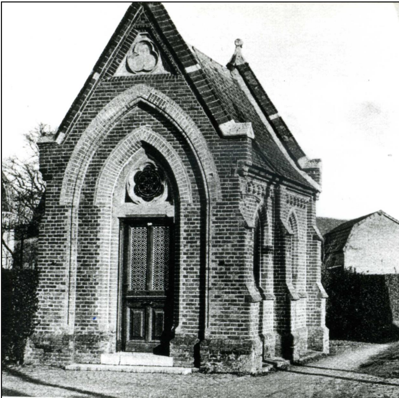
Fig. 2. De voormalige St. Luciakapel te Staat.

Ik hoop dat jullie hier iets mee kunnen. Laat je een keer weten wat de uiteindelijke naam geworden is?