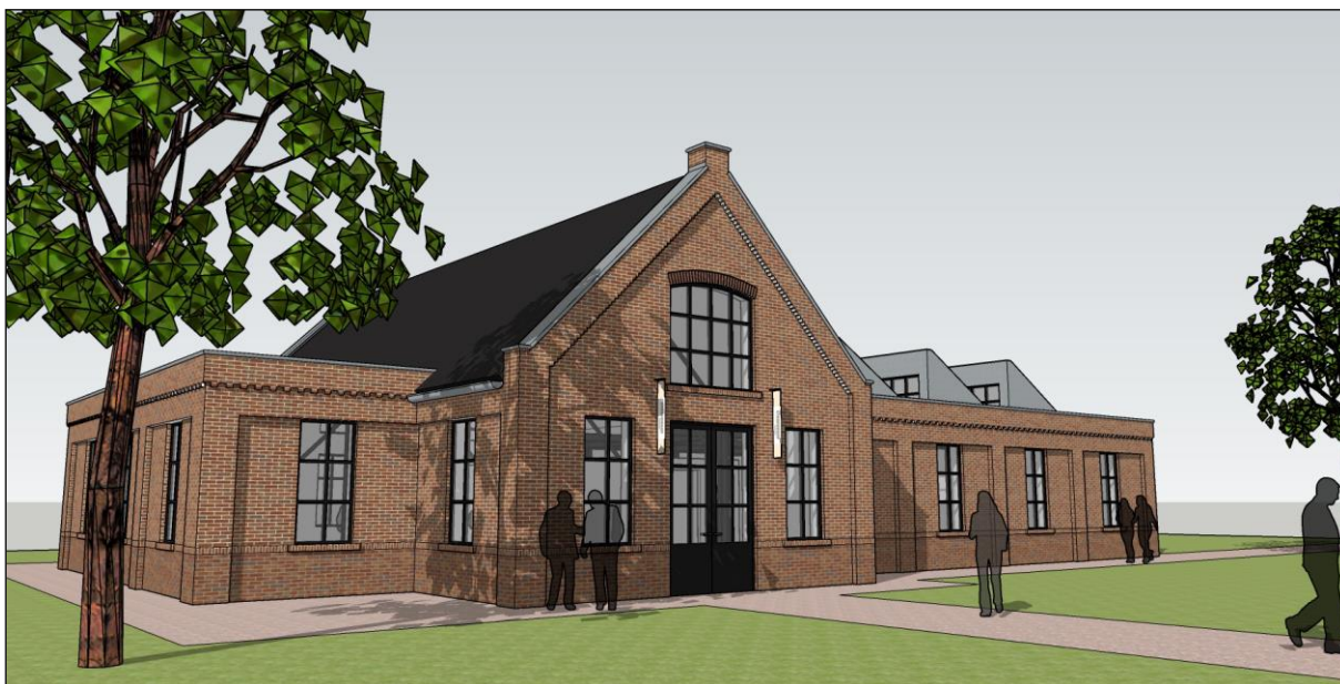
Fig. 7. Artist's impression van het ambachtengebouw. Illustratie: Eijnderhoof.

Het nieuwe ambachtengebouw van Eijnderhoof is geïnspireerd op een nog bestaand gebouw in Weert in dertigerjaren-bouwstijl. Het komt te liggen aan de oostelijke periferie van het museumterrein en zal huisvesting bieden aan een aantal ambachten die nu nog verspreid over het terrein in al dan niet tijdelijke locaties gehuisvest zijn. Met zou het een 'gemeenschapshuis avant-la-lettre' kunnen noemen. Waar zowel ambachtelijke ateliers als kleinere publieksfuncties hun gemeenschappelijke plek moeten krijgen.