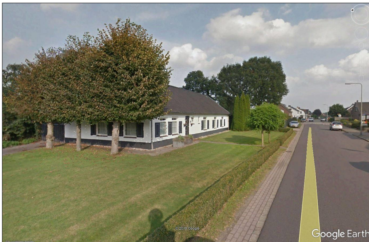
Fig. 9. De boerderij in 2018.