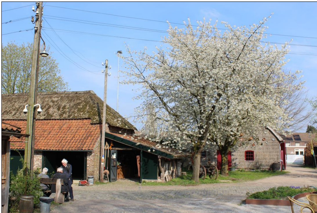
Fig. 1. Eijnderhoof tijdens de contactdag van de Stichting Kruisen en Kapellen in Limburg, april 2019.

Door bestuursvoorzitter Peter Willekens is in mei 2019 gevraagd om een serie namen voor te stellen voor een viertal bestaande, in aanbouw zijnde of geplande objecten op het terrein van het Limburgs Openluchtmuseum Eijnderhoof. Het betreft het entreegebouw, de kiosk in het hart van het museumterrein, de geplande boerderij-omgeving in de westelijke zone van het terrein en het nieuwe ambachtengebouw.