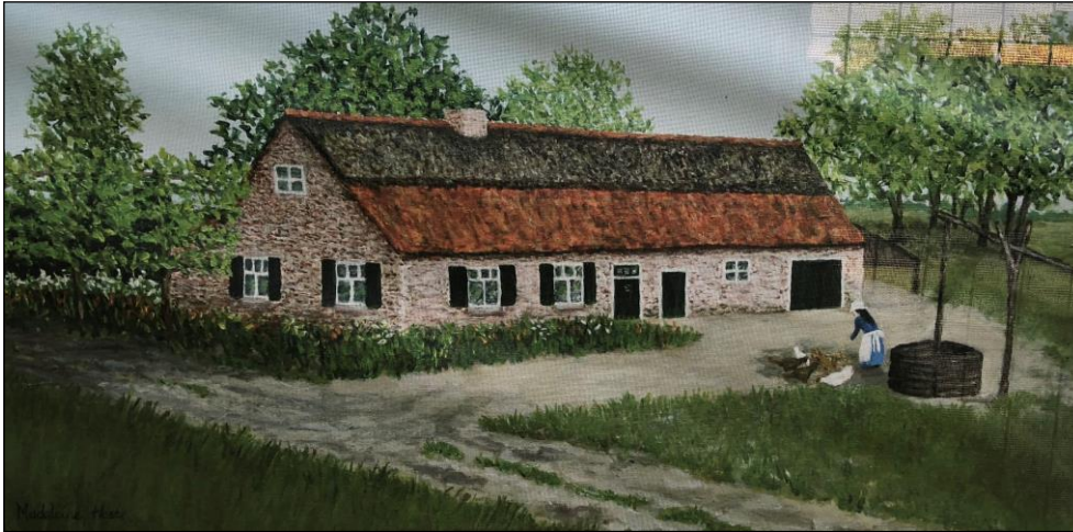
Fig. 4. Artist's impression van de peelboerderij in Eijnderhoof. Illustratie: Madeleine Hoste.

De peelboerderij is een replica van een bestaande Eindse hoeve en zal dan ook de oorspronkelijke naam (' Bi-j Klusse Kerneel ') gaan dragen. De boerderij vormt de kern van een groter zelfvoorzienend ensemble bestaande uit utiliteitsgebouwen voor vee en boerderijdieren, akker, moestuin, weiland en brandkuil. Het verhaal dat hier verteld gaat worden is dat van de voedselproductie. Een educatief project om kennis over de herkomst en productie van onze dagelijkse voedsel voor een jong publiek te illustreren.