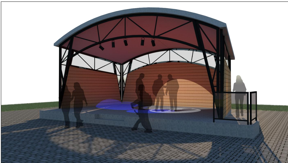
Fig. 3. Artist's impression van de kiosk. Illustratie: Eijnderhoof.

De kiosk is in tegenstelling tot de meeste andere objecten op het museumterrein een zeer modern en daardoor in het oog springend gebouw. Gelegen in het hart van het openluchtmuseum en grenzend aan een buitenterras met horecafunctie. De kiosk gaat onderdak bieden aan muziekoptredens, biedt bescherming tegen de elementen bij openluchtactiviteiten die geen neerslag kunnen verdragen, zal de plek zijn voor oude kinderspelen en een algemene podiumfunctie vervullen. Er zal dus voornamelijk gespeeld worden, door kinderen en door muzikanten.