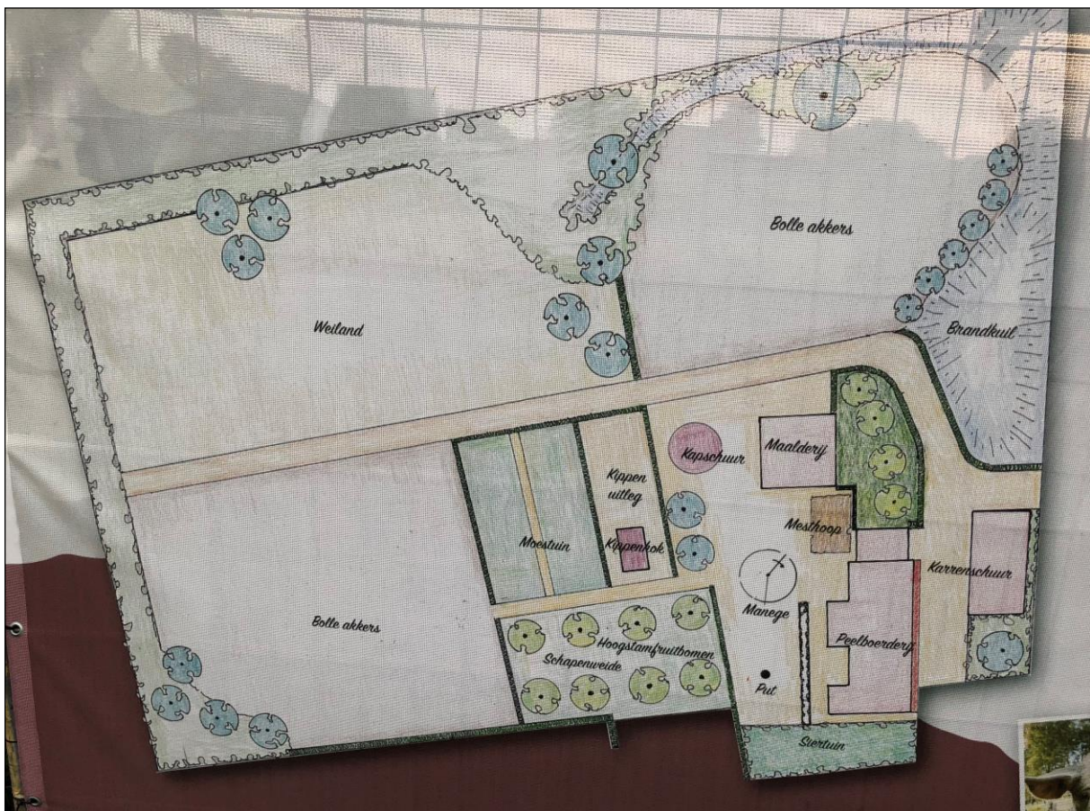
Fig. 5. Concept-plattegrond van de inrichting van de omgeving van de peelboerderij. Tekening: Eijnderhoof.