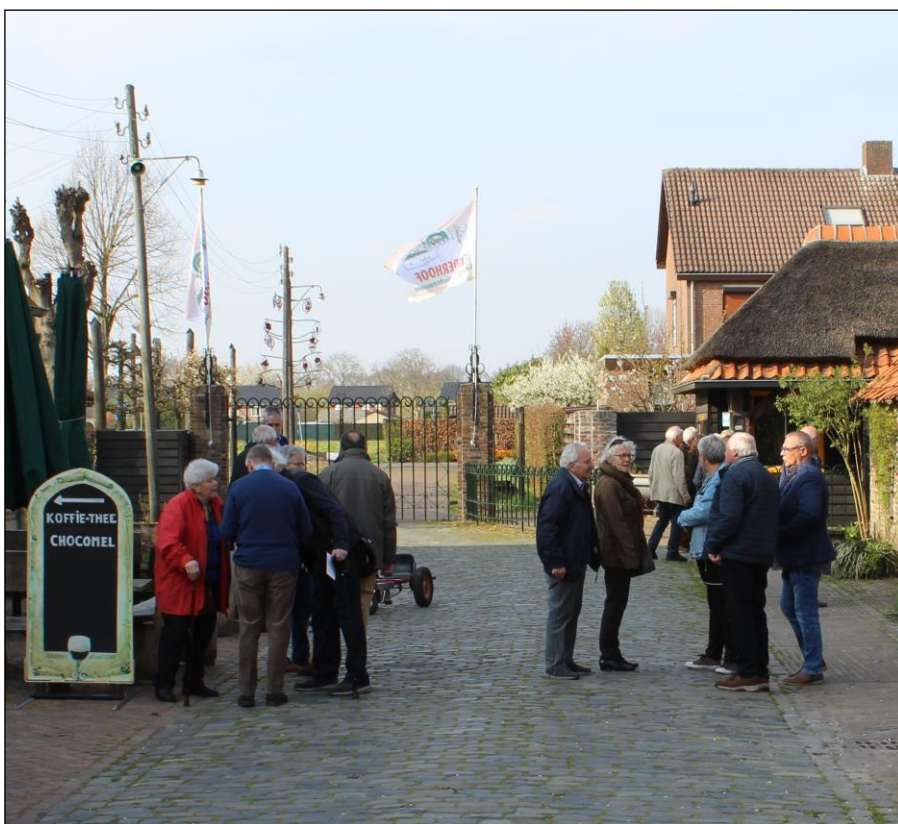
Fig. 2. Entreegebied van Eijnderhoof. Geheel rechts het entreegebouw.

De functie van het gepotdekselde en van rieten kap voorziene entreegebouw is die van museumwinkel en entreekassa. Dit gebouw is geen replica van een bestaand gebouw, maar in historiserende stijl gebouwd fantasie-ontwerp. Het object is fysiek gekoppeld aan een hekwerk met een soort poortje waarlangs de bezoekers min of meer 'gedwongen' langs kassa en winkel worden geleid.