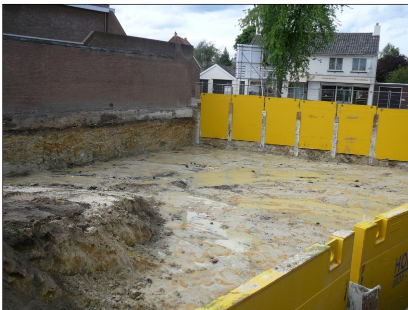
Figuur 3. Bouwput gezien richting noorden.

De verwachtingswaarde van het terrein was relatief laag aangezien het terrein voor zover bekend is altijd onbebouwd is geweest. Wel grenst het aan de zuidzijde van het tracé van een oude gegraven waterloop, de zogenaamde Weerterbeek. De waarnemingen waren er daarom op gericht om sporen van het oude beektracé terug te vinden.