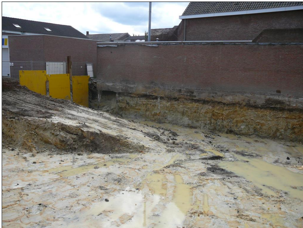
Figuur 4. Zicht op de zuidwesthoek van de bouwput. In het achterste deel van de hoek bevindt zich de insteek van de oude waterloop.

In de uiterste zuidwesthoek van de bouwput werd een bodemspoor aangetroffen dat de oude waterloop vrijwel loodrecht coupeerde. Het spoor was plaatselijk zwaar verstoord door de betonpoeren van het westelijke gelegen gebouw uit de jaren '90 van de vorige eeuw.