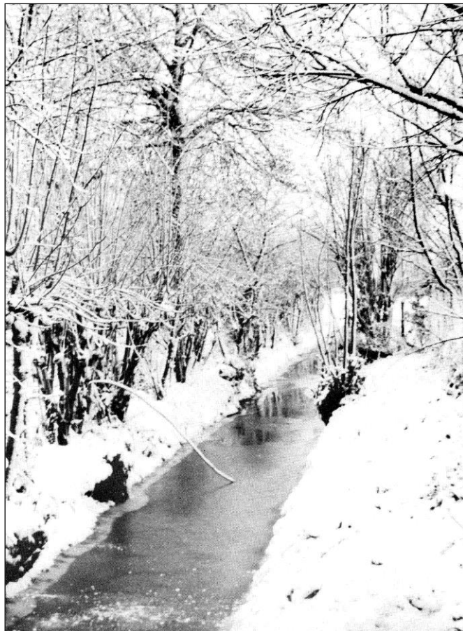
Figuur 7. Foto van de Weerterbeek uit 1933. Genomen ca. 100m ten oosten van het gebied van het archeologisch onderzoek.

In 1867 werd als gevolg van een besluit van het gemeentebestuur de waterloop verlegd vanuit de Kerkstraat naar áchter de huizen aan de westelijke zijde. De situatie bij het brouwershuis bleef onveranderd. In 1934 besloot het gemeentebestuur om de beek door rioolbuizen te vervangen.