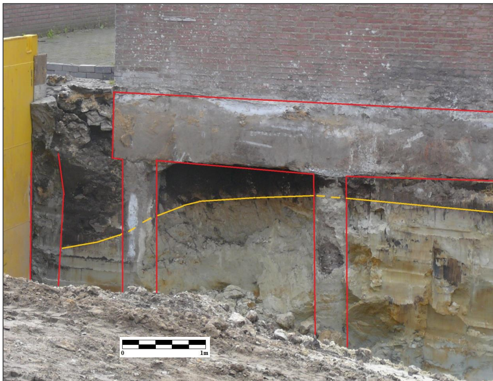
Figuur 5. Zuidwesthoek. De gele lijn markeert de insteek van de oude waterloop. In rood de recente verstoringen door de betonfundering van het westelijke gebouw.