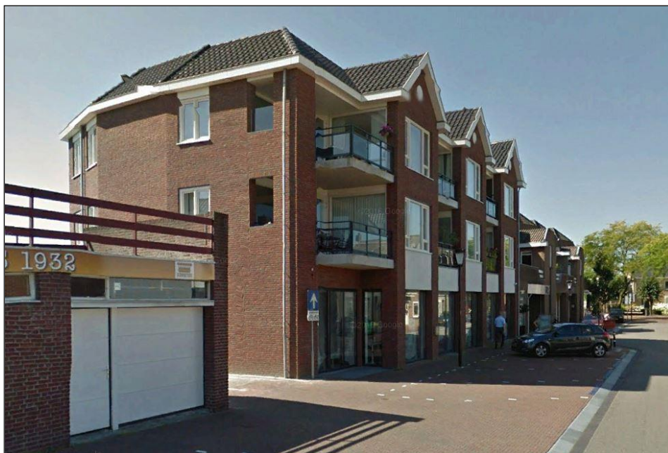
Figuur 1. Het uiteindelijk gerealiseerde appartementencomplex (situatie in 2017), nu adres Lindanusstraat 14-28.

Bij de aanleg van de bouwput werden beperkte waarnemingen gedaan. Deze rapportage doet daarvan verslag.