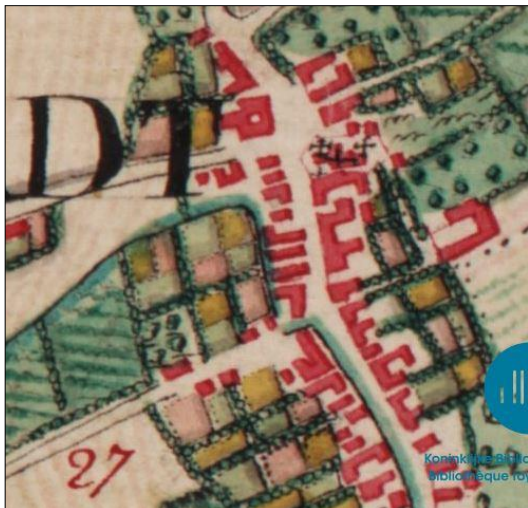
Fig. 14. Ferrariskaart ca. 1776. Het noordelijke tracé ligt achter de huizen, het zuidelijke tracé ligt in de Kerkstraat. Het noorden ligt boven.

In 1867 werd het zuidelijke tracé van de Weerterbeek op initiatief van het gemeentebestuur verlegd van de Kerkstraat naar de westzijde van de huizen. Oude kaarten tonen kadastrale sporen die er op wijzen dat ook het noordelijke tracé ooit op die manier verlegd is.