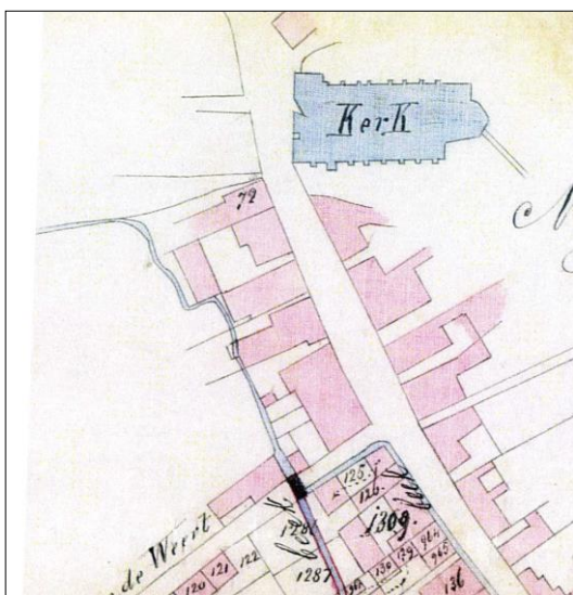
Fig. 16. Plan voor verlegging van het zuidelijke deel van de Weerterbeek. 1867, ook daadwerkelijk uitgevoerd.