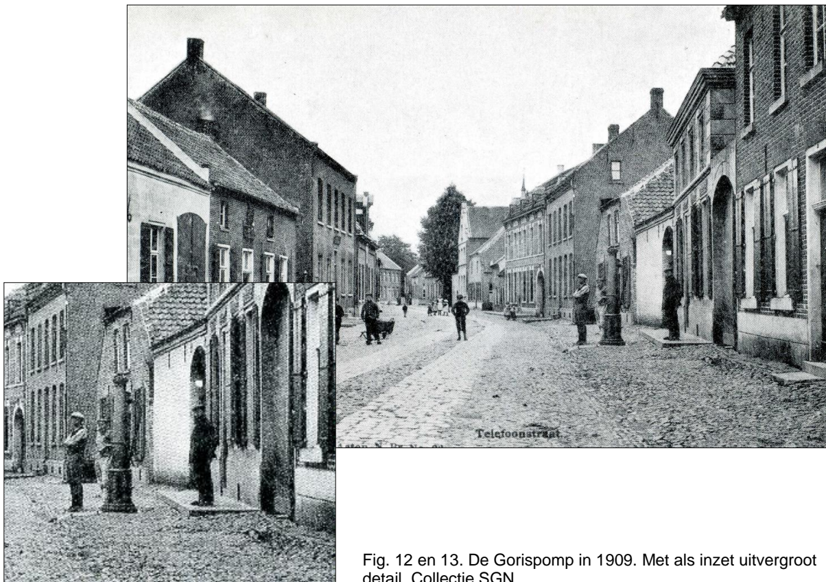
Fig. 12 en 13. De Gorispomp in 1909. Met als inzet uitvergroott detail.

Een andere getuigenis over de Gorispomp is onderstaand fragment: