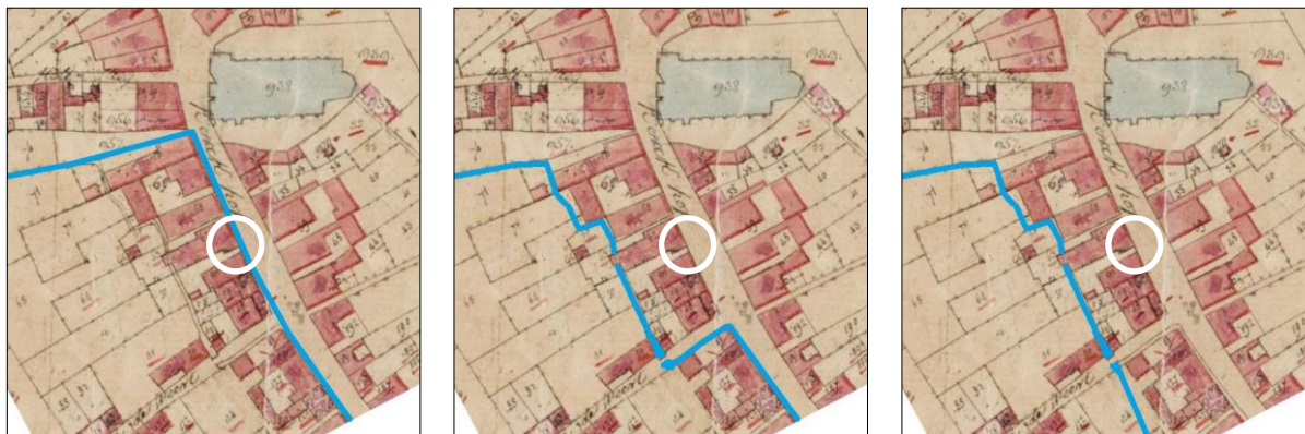
Fig. 18, 19 en 20. Drie fasen in de chronologie van de loop van de Weerterbeek. Links: oudste fase, ongedateerd. Midden: fase tussen 1754 (of eerder) en 1867. Rechts: fase vanaf 1867. Ondergrond: kadastrale minuutplan van 1844. De witte cirkel is de onderzoekslocatie. Tekening: Alfons Bruekers.

Dit leidt dan tot de volgende fasering van de loop van de Weerterbeek in het noordelijke deel van de Kerkstraat: