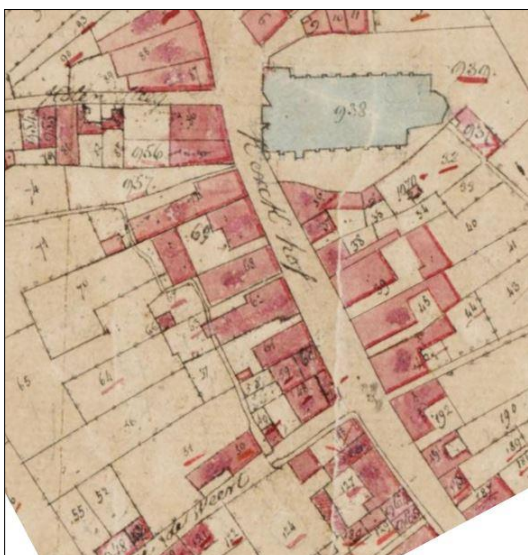
Fig. 15. Kadastrale minuutplan 1844. De situatie is wat de beek betreft ongewijzigd ten opzicht van die van de Ferrariskaart.