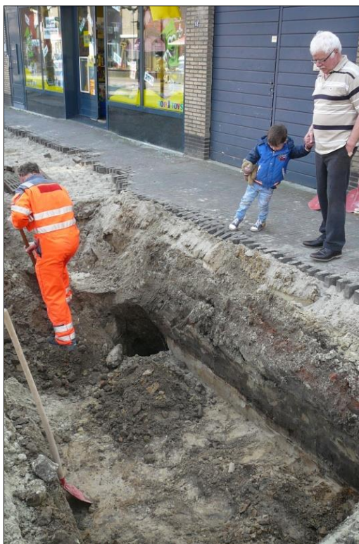
Fig. 7. Aan de zuidzijde van het profiel bevond zich een plaatselijke verdieping (spoor 6).