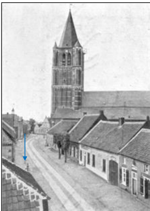
Fig. 9. de oudste afbeelding van de Gorispomp, ca. 1895. Alleen het bovenste stukje van de pomp is te zien (blauwe pijl).

De putten waren naar we mogen aannemen tot heuphoogte boven het maaiveld opgemetseld en voorzien van putwip en emmer. De ene put lag pal voor de St. Lambertuskerk en de andere put in zuidelijke richting in diezelfde Kerkstraat, ter hoogte van het huidige Lambertushof. Op het einde van de negentiende of begin van de twintigste eeuw werd op de beide putten een gietijzeren pomp geplaatst. De pomp bij de kerk heette in de volksmond de Kerkpomp en de tweede pomp de Gorispomp, de laatste genoemd naar de familie die het nabijgelegen huis bewoonde.