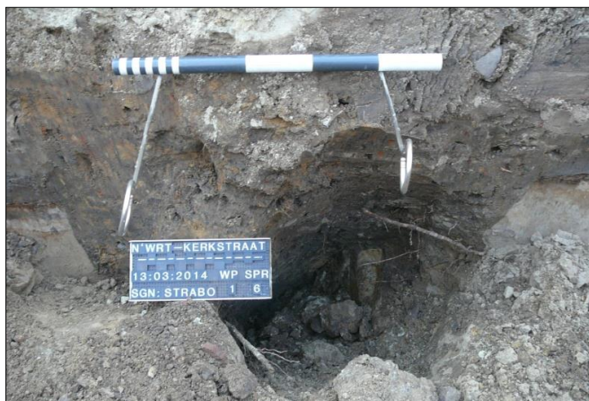
Fig. 8. Insteek links en rechts, van spoor 6.

In overleg met betrokkenen van de gemeente Nederweert en de aannemer is ter plekke besloten om geen verder onderzoek te doen naar deze put, omdat de mogelijkheden vanwege aangrenzende bomen té beperkt waren, en vanwege het ontbreken van aanwijzingen van een insteek (die bij de kerkput zo richtinggevend waren geweest). De zoeksluif werd gedicht en geëgaliseerd.