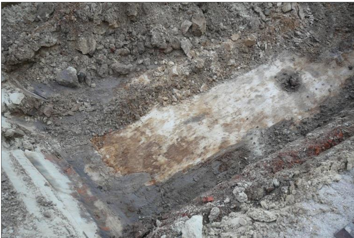
Fig. 4. Bovenaanzicht van de zoekseuf, rechtsonder een strookvormige humeuze zone, vermoedelijke de periferie van een greppel.

grond. Zodat er hier ook geen sprake zal zijn geweest van een trechterinsteek. Vermoedelijk zal de waterput zich meer in zuidelijke richting hebben bevonden.