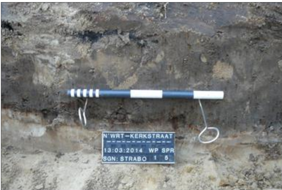
Fig. 5. Detailopname onderzijde spoor 5, met goed-zichtbare houtskoollaag.