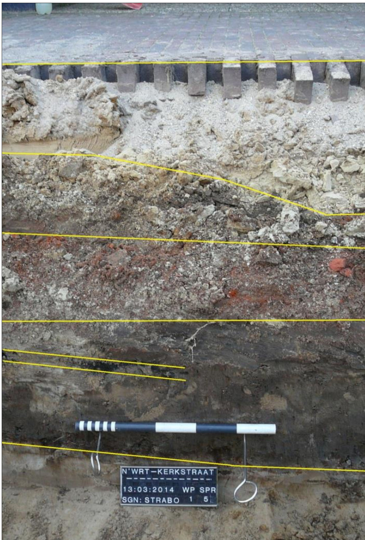
Fig. 6. Profiel van spoor 5. Van boven naar beneden: vulzand, ophogingslaag, puinzone, humeuze vulling met houtskoollaag en tenslotte steriele onderlaag.