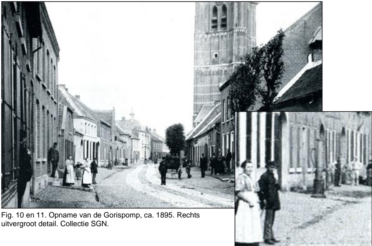
Fig. 10 en 11. Opname van de Gorispomp, ca. 1895. Rechts uitvergroot detail. Collectie SGN.

In 1766 wendden de gezamenlijke bewoners van de Kerkstraat zich in een petitie tot het gemeentebestuur. Wegens de aanhoudende droogte maakten zij zich zorgen over het gebrek aan bluswater voor de brandbestrijding. Expliciet noemen zij de twee gemeentelijk waterputten in de Kerkstraat, die 'bij dese tijde geen twee tonnen waters souden kunnen bijbrengen' .