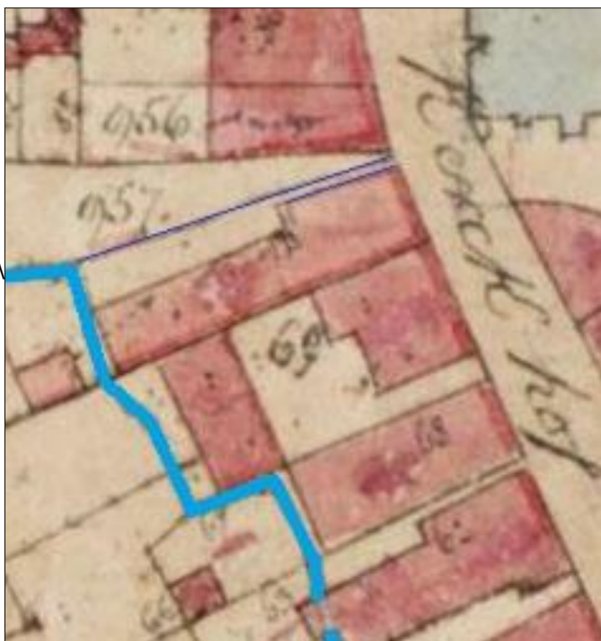
Fig. 17. Het noordelijke tracé van de Weerterbeek (lichtblauw). De donkerblauwe lijnen markeren oude kadastrale grenzen die wellicht wijzen op een oudere, tot in de Kerkstraat lopende, beekbedding. tekening: Alfons Bruekers.

Bijzonder interessant is dat op het kadastrale minuutplan van 1844 nog perceelsgrenzen zichtbaar zijn die aanduiden dat het noordelijke tracé van de beek oorspronkelijk ook in de Kerkstraat, dus vóór de huizen, heeft gelopen. Pas later (en dat moet dan dus vóór 1776 zijn geweest) is de beek in dat gedeelte van de Kerkstraat naar de westzijde van de huizen verlegd. Een operatie die in 1867 werd herhaald met het zuidelijke tracé. Hierin zit dan ook de verklaring voor het vrij kronkelige karakter van de beek aan de westzijde van de huizen. Dat tracé oogt niet planmatig maar eerder opportunistisch, de bestaande bebouwing zo veel mogelijk ontziend en tegelijkertijd geen sta in de weg vormend voor tuinen en boomgaarden.